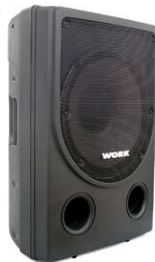
WPL - BASS A