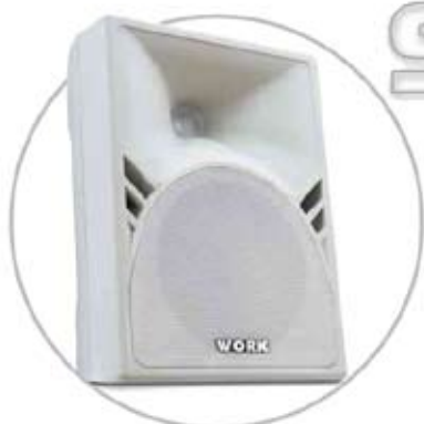
STUDIO 50 A