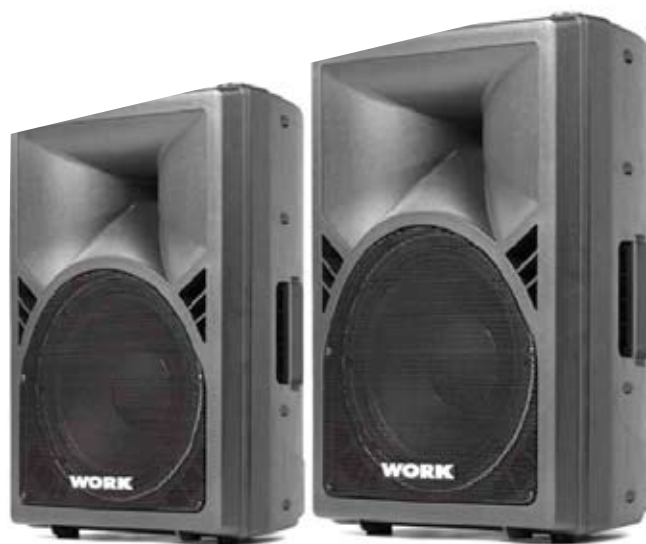
WPL - 1A

Den er også forberedt for å kunne flys (v.h.j.a. tilleggsutstyr). Det følger også med braketter for bruk som monitor.