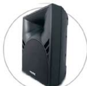
STUDIO 40 A