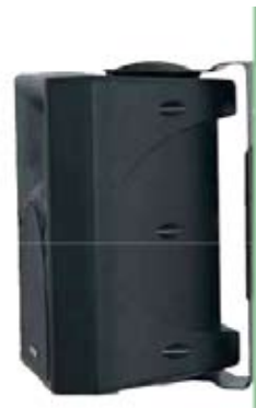
Veggbrakett leveres med

For å komplettere WPL-serien leverer WORK STUDIO-serien som i design og utførelse er helt lik WPL, men i mindre kabinett. STUDIO-serien leveres i to varianter, 6,5" og 8" med tweeter., begge i aktiv versjon. De er 2-veis og leveres i hvit eller sort og med standard brakett, og kabinettene er i robust ABS-plast. Disse høytalerne er spesielt godt egnet i forretningslokaler, gallerier, konferanserom, forsamlingslokaler etc.